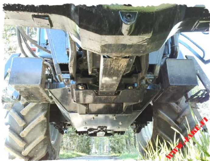
Без JAKE Защиты Двигателя