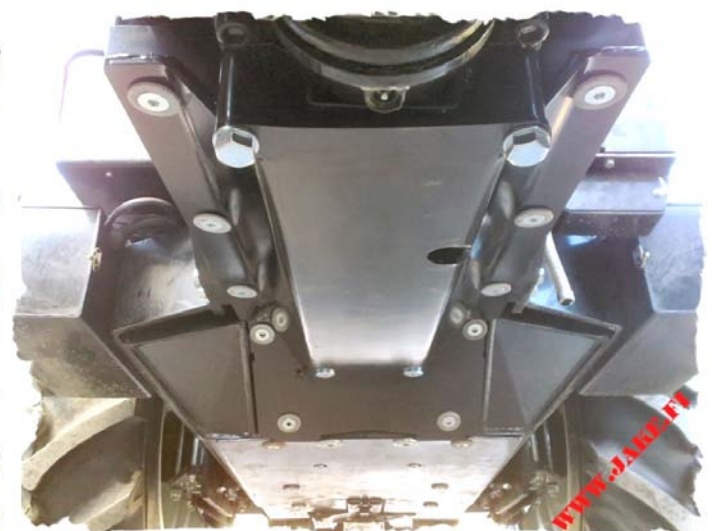
С JAKE Защитой Двигателя